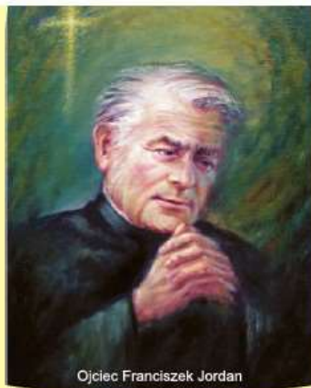
Ojciec Franciszek Jordan

Możesz również złożyć darowiznę bezpośrednio na konto Fundacji o numerze: 81 1020 2906 0000 1902 0129 4404