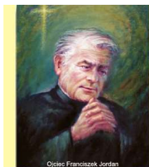
Ojciec Franciszek Jordan

Możesz również złożyć darowiznę bezpośrednio na konto Fundacji o numerze: 81 1020 2906 0000 1902 0129 4404