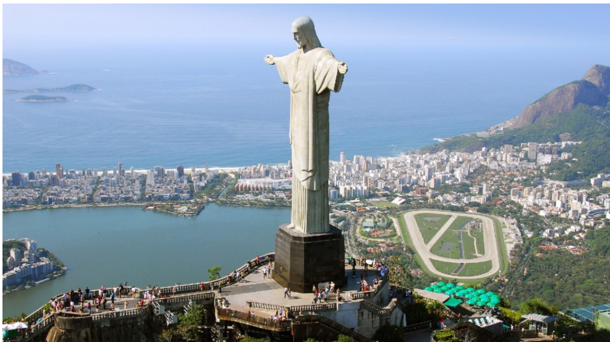
Pomnik Chrystusa Zbawiciela w Rio de Janeiro